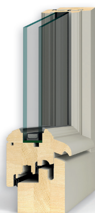
SECURA 68 mm TRADI